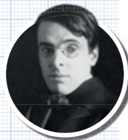
William Butler Yeats, Ierse dichter en schrijver, 1865 – 1939

'Er zijn geen vreemdelingen hier, alleen vrienden die je nog niet hebt ontmoet.'